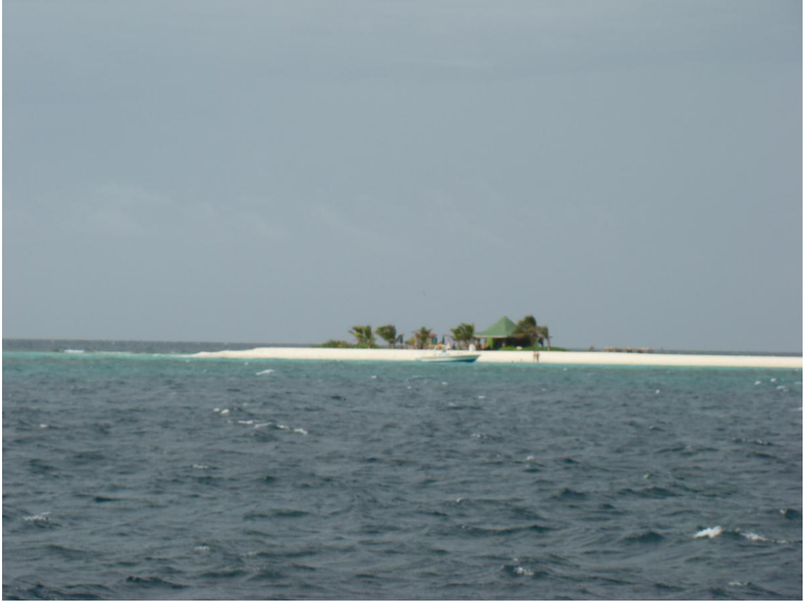
Virgin Gorda 8/07/10