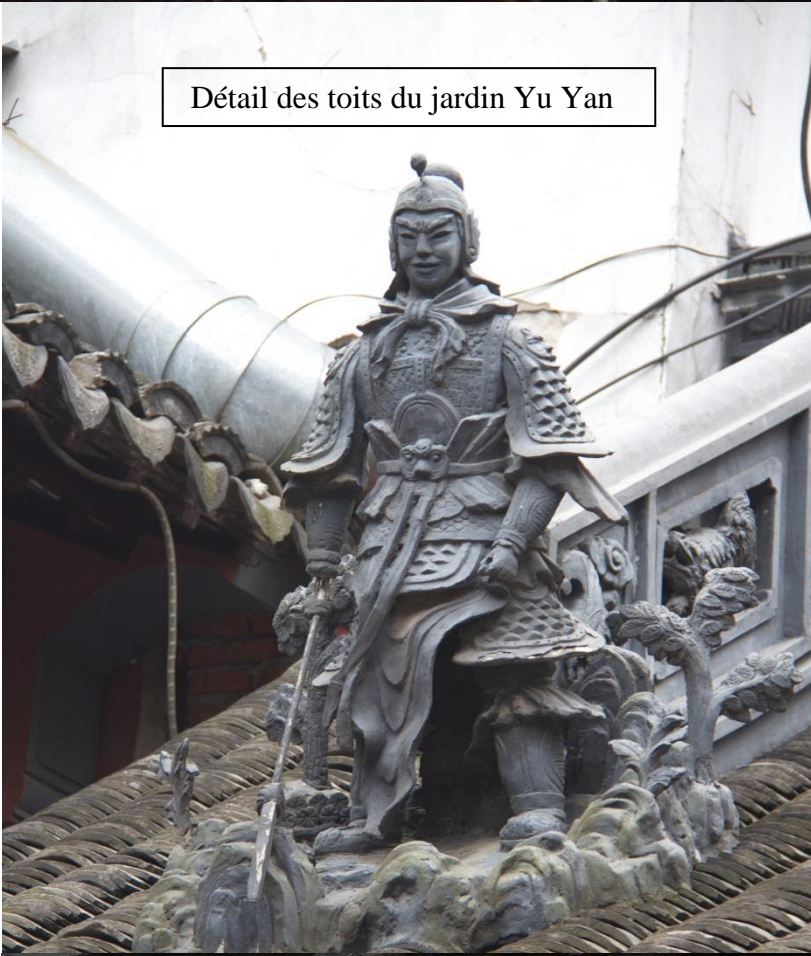
Détail des toits du jardin Yu Yan