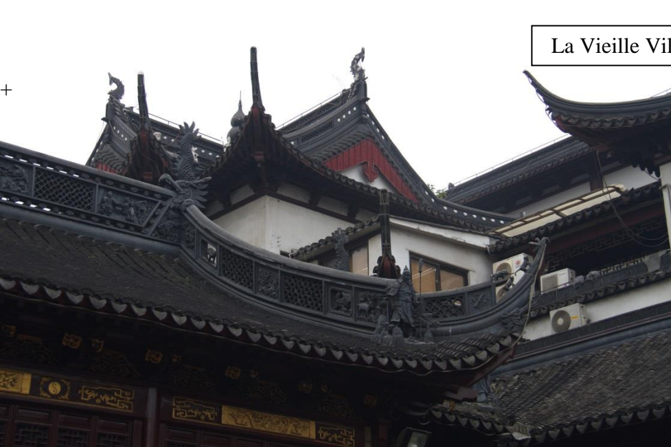
La Vieille Ville