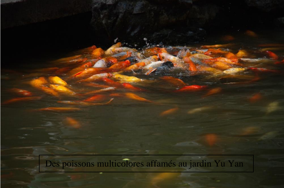
Des poissons multicolores affamés au jardin Yu Yan