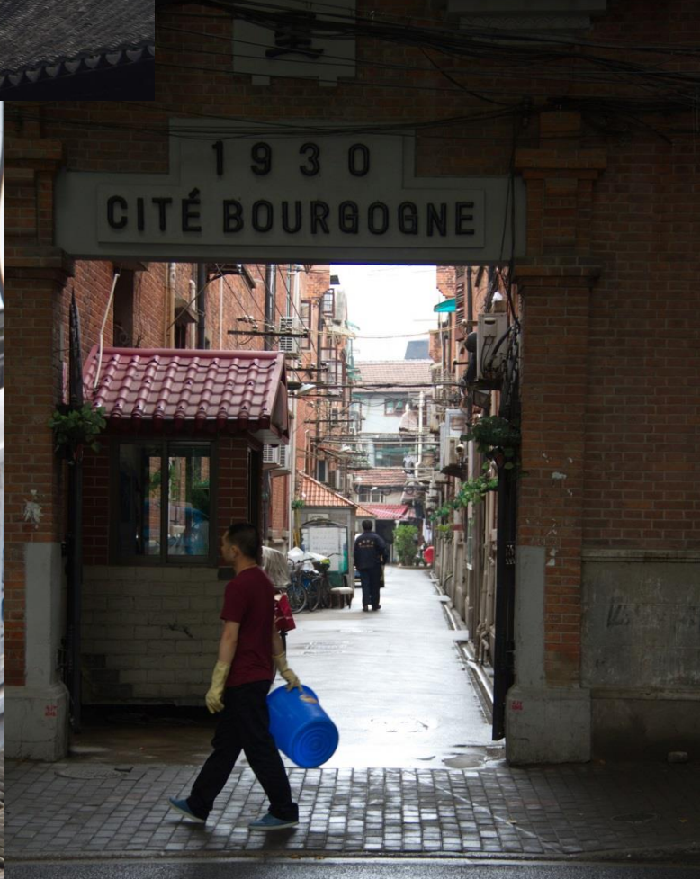
Les restes de la concession Française