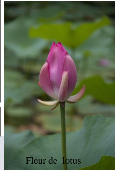
Fleur de lotus

Logement, transport, nourriture 50% moins cher qu'en métropole.